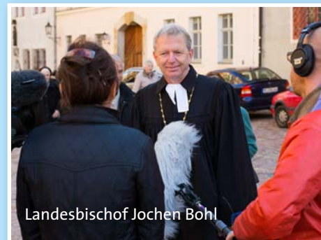
Landesbischof Jochen Bohl