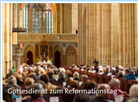
Gottesdienst zum Reformationstag