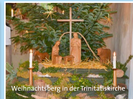
Weihnachtsberg in der Trinitatiskirche